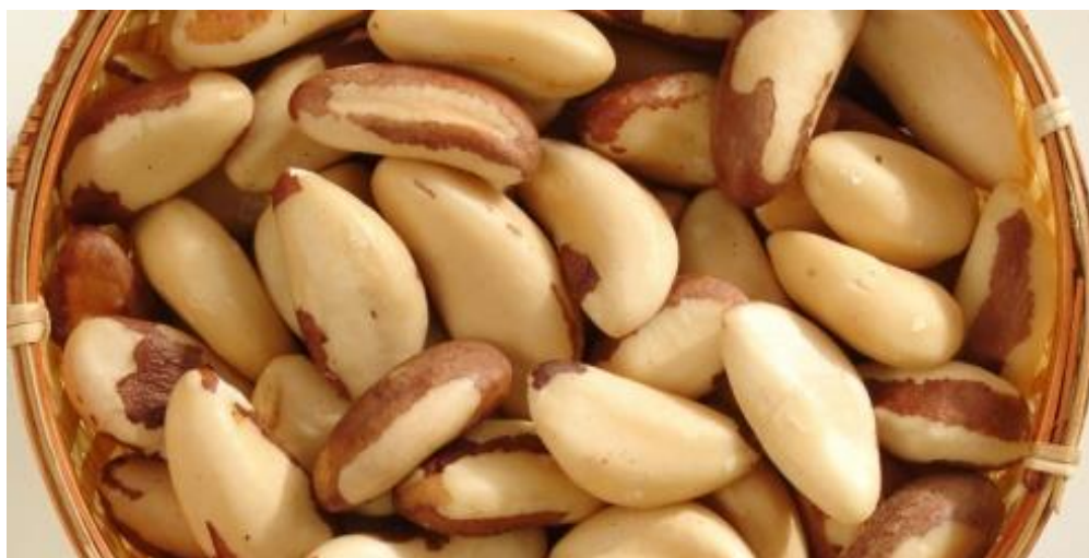
Figura 6 Castanha-do-Pará

local, é conhecida pela população como castanha-do-pará, tocari, castanha-do-Brasil, castanha-do-Acre, ou como tucuri. A seguir na Figura 6 o fruto da castanha-do-pará: