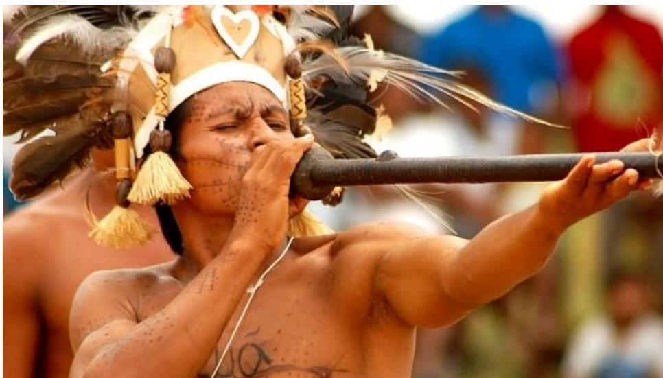
Figura 7 - Utilização do Curare pelos índios

A substância foi patenteada pelas empresas Wellcome, Abbot e Eli Lilly dos Estados Unidos, a partir do ano de 1943. Ficando detentoras assim de relaxantes musculares provenientes da substância.