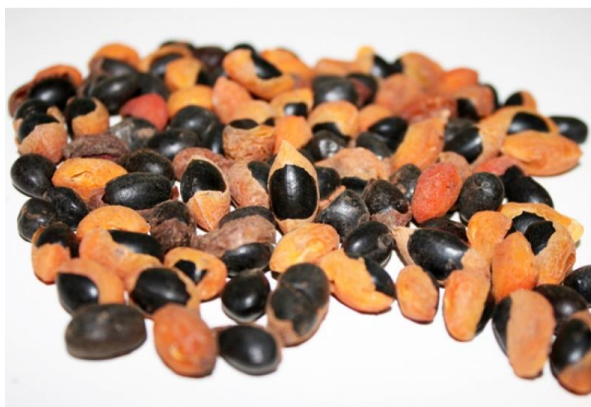
Figura 12 - Sementes de Copaíba

Mais um caso aconteceu no ano de 1993, com empresas europeias e americanas, o patenteamento da Copaíba, fornecedora de um importantíssimo óleo, capaz de tratar doenças dermatológicas, tais como caspa, dermatites e dermatoses. Auxilia também na cura de úlceras no estômago, como diurético, antisséptico, estimulante, vermífica, contraceptivo, substância que acende os lampiões, na elaboração de essências e remédios, e até nos procedimentos de revelação de fotos. A Figura 12 demonstra as sementes oriundas da Copaíba.