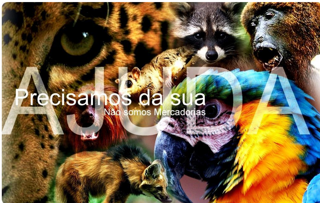
Figura 17 - Projeto Drake