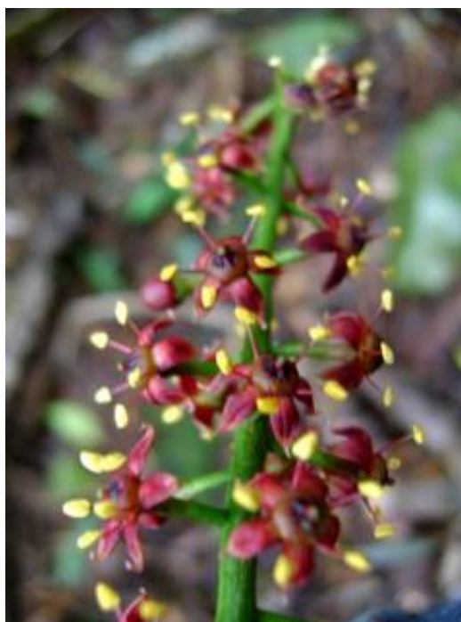
Figura 8 - Planta Jaborandi