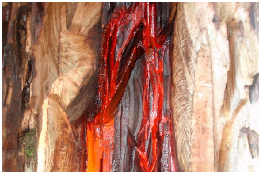
Figura 1 - Pigmento extraído do Pau-Brasil