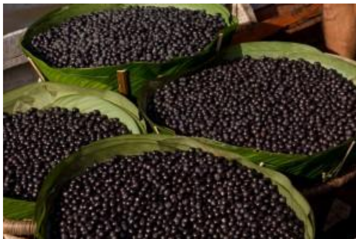
Figura 15 - Fruto do Açaí