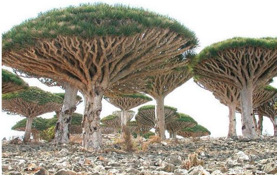
Figura 9 - Planta Sangue de Dragão

nome porque ao ser cortado escorre um líquido vermelho, semelhante ao sangue. As figuras 9 e 10 representam a planta Sangue de Dragão.