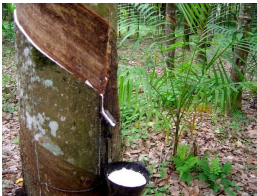
Figura 5 - Extração do látex a partir da planta seringueira

Por seguinte ocorreu mais um caso de biopirataria que atingiu vigorosamente a região norte do Brasil. A Amazônia era o território mais abastado do país e dependia economicamente da fabricação de borracha produzida a partir do látex, extraído das seringueiras, com nome científico Hevea brasiliensis . A extração do látex é ilustrada na Figura 5: