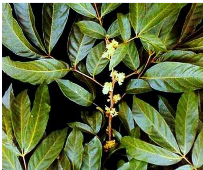
Figura 11 - Ptychopetalum spp

A planta amazônica muirapuama ( Ptychopetalum spp. ) de onde provém o remédio Viagra, substância afrodisíaca, foi patenteada no Japão em 20 de julho de 1993 pela empresa Taisho Pharmaceutical Co. Ltd. e posteriormente outros países patentearam a substância, a Austrália, Estados Unidos, Coréia, Comunidade Européia e Canadá. (HATHAWAY, 2002). A figura 11 ilustra a planta de onde é oriunda o Viagra.