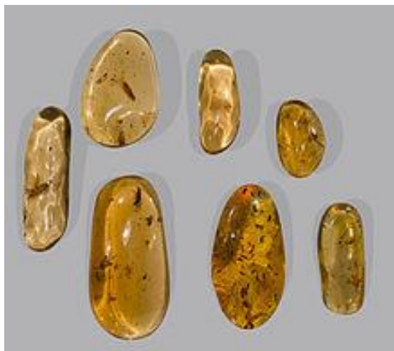
Figura 3 - Copal

Na época o Brasil era um ambiente informal de desenvolvimento da goma copal, uma resina natural, ilustrada na Figura 3, oriunda de árvores leguminosas cujos nomes científicos são Hymenaea maritima e Hymenaea stigonocarpa . Naquele período, Portugal adquiria a substância de outras regiões do mundo, não conhecendo a existência da goma copal em sua colônia.