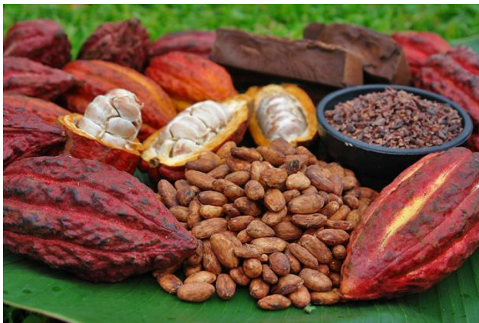
Figura 2 - Fruto do Cacau