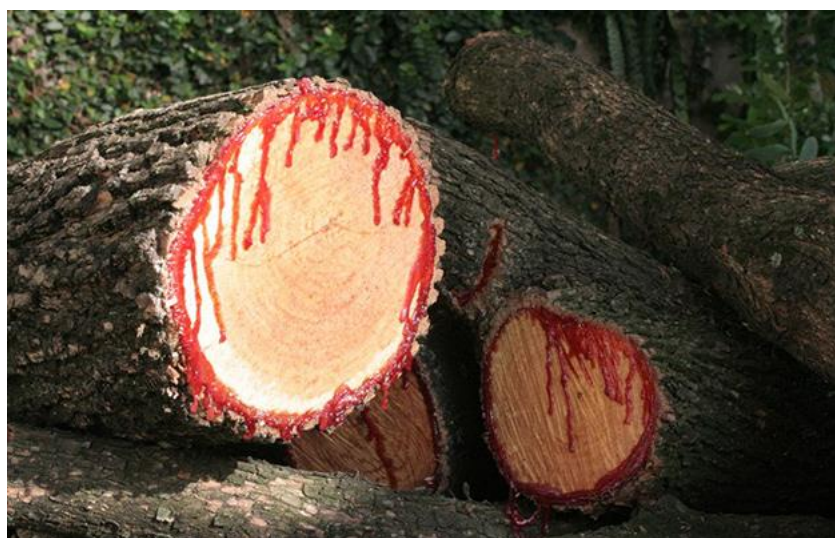
Figura 10 - Sangue de Dragão: A árvore que chora