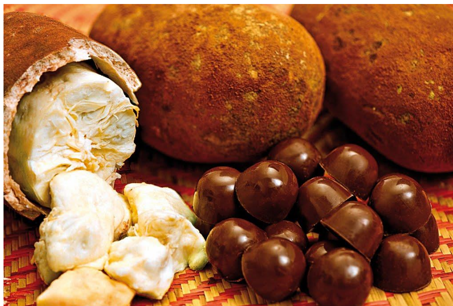
Figura 14 - Cupuaçu e o "Cupulate"