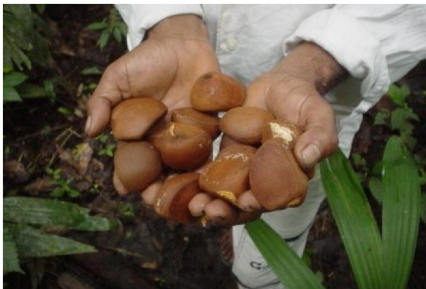
Figura 13 - Sementes da Andiroba

A andiroba ( Carapaguanensis aubi ) é um arbusto regional, da qual é provido um óleo a partir de suas sementes e que era muito usufruído pelos nativos nos mais variados aspectos, tais como insetífugo, medicamento e combustível para luminosidades primitivas. A figura abaixo demonstra as sementes da andiroba: