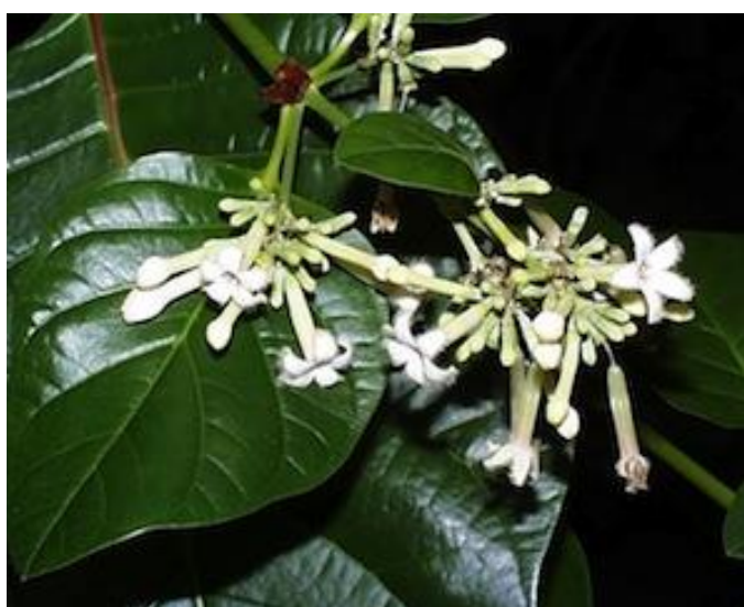
Figura 4 - Planta Chinchona

Em 1865, a substância quinina, originária da planta cinchona ( Cinchona officinalis ), conforme é ilustrada na Figura 4, foi contrabandeada para a capital da principal ilha da Indonésia, a cidade de Java.