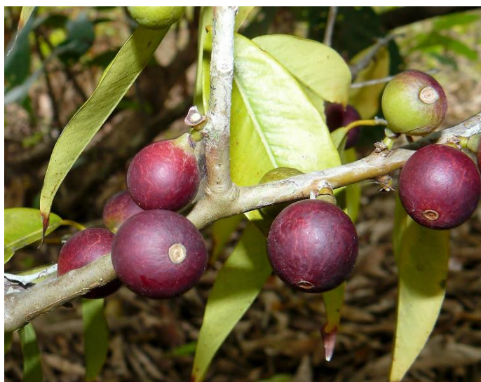
Figura 16 - Myciaria dubia

O novo objeto de cobiça dos estrangeiros chamasse camu-camu ( Myciaria dubia ), ilustrada na figura 16, uma fruta oriunda da Amazônia que comparada com a acerola detêm uma proporção de vinte vezes mais vitamina C, e comparada com a laranja e o limão, possui oitenta vezes mais.