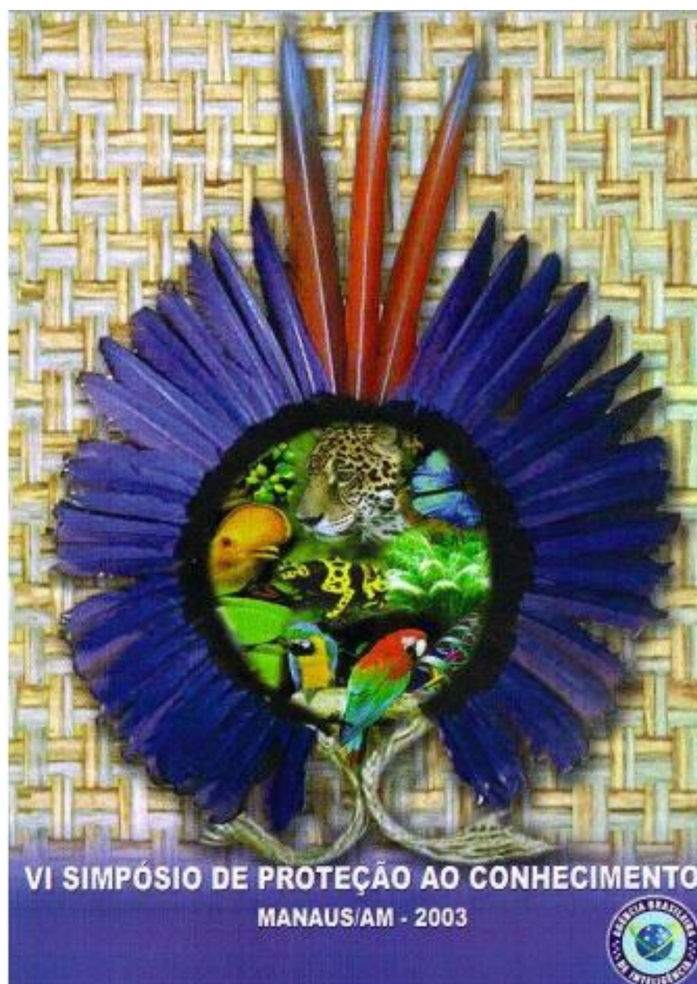
Figura 19 - Cartaz de divulgação do VI Simpósio de Proteção ao Conhecimento